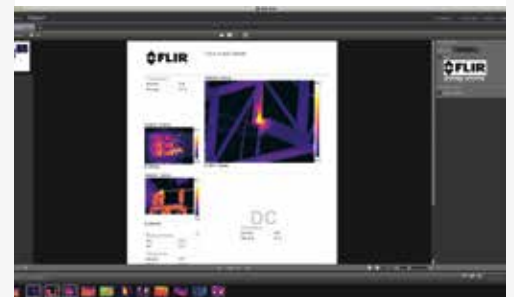
Vous pouvez ajouter une description aux images et des commentaires textuels et vocaux, pour créer des rapports incontestables et faciles à interpréter.