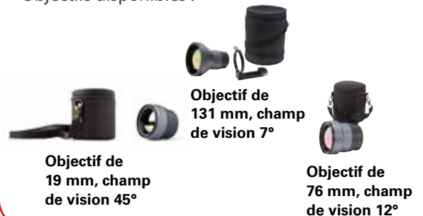
Objectif de 19 mm, champ de vision 45°